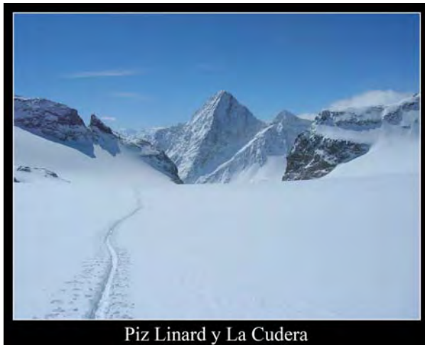
Piz Linard y La Cudera

2:42 Llegamos al collado de Fourcla dal Cunfin (3042m), paso fronterizo entre Austria y Suiza. Desde aquí vemos el pico más alto del macizo, el Piz Linard (3410m), escalable pero no esquiable. También vemos el Silvrettapass, collado de acceso al glaciar Silvretta y su refugio. Por debajo, una extensa llanura