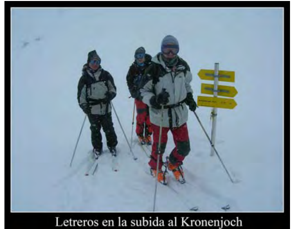
Letreros en la subida al Kronenjoch

1:15 Siguiendo la huella de un grupo numeroso, llegamos hasta unos 2500 metros. En la