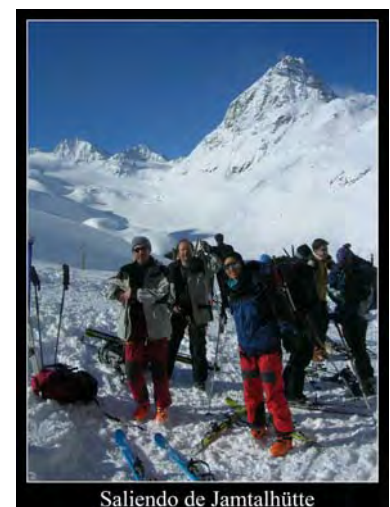
Saliendo de Jamtalhütte

0:00 Cuando salimos, a las 9:00, ya está totalmente despejado. Varios grupos han salido por delante, por lo que aprovecharíamos su huella lo máximo posible.