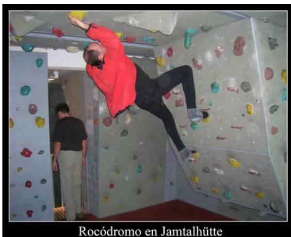
Rocódromo en Jamtalhütte

bajada, que casi no esquiamos, la huella desaparecía por momentos... El resto del tiempo lo dedicamos a echar unas risas, ver cómo nevaba, intentar un jaque mate, “escalar” en el rocódromo, comer y esperar que se cumpla el pronóstico para el día siguiente.