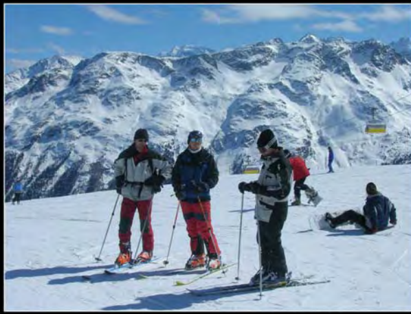
Pistas de Corviglia, en St. Moritz