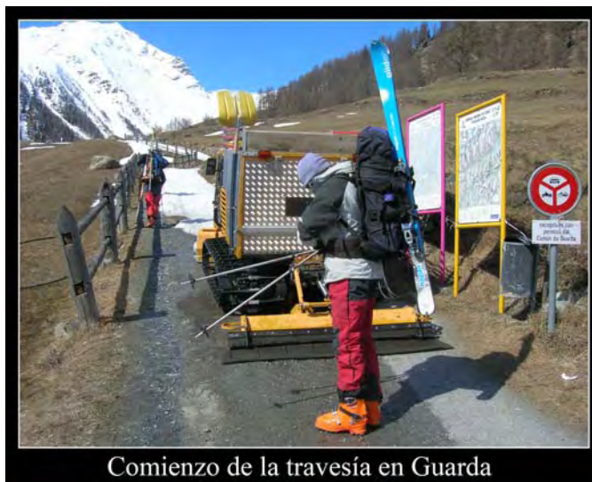
Comienzo de la travesía en Guarda

lleven el coche...), comenzamos a foquear a las 13.10 casi desde el mismo pueblo. Al principio seguimos una pista que se adentra en un bosque muy bonito. El tiempo es muy bueno, aunque conforme vayamos acercándonos al refugio se iría levantando un viento que presagiaba el cambio que tendríamos para los días siguientes. Salimos del bosque y ascendemos ligeramente por la derecha (margen izq.) del barranco. Aunque no vemos el refugio, no hay pérdida. Además, hay estacas que señalizan el camino en caso de mala visibilidad. Y es que estamos en los Alpes, montañas mucho más humanizadas que nuestros Pirineos.