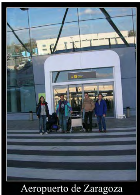
Aeropuerto de Zaragoza

Salimos de Zaragoza (18.15) con Ryan Air en vuelo directo a Bérgamo (20.00). Recogemos el coche que teníamos alquilado y llegamos al apartamento de Chiavenna sobre las 23.00.