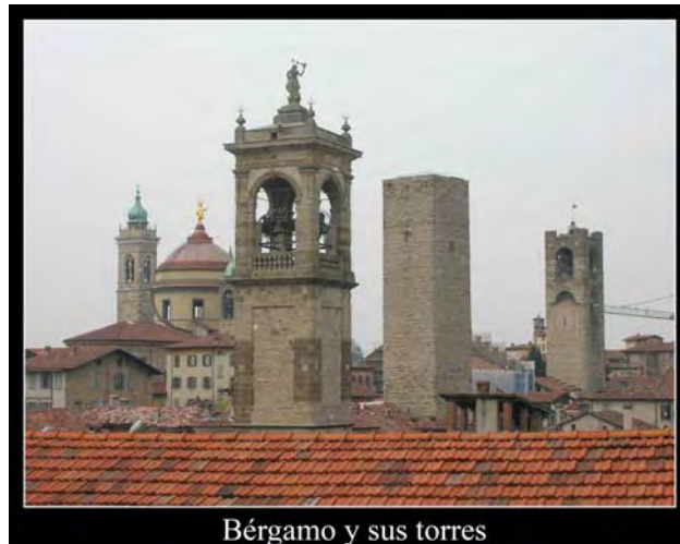
Bérghamo y sus torres

Y el último día paseamos por Bérghamo, aunque para algunos no era la primera vez.