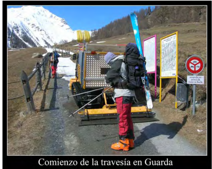
Comienzo de la travesía en Guarda

lleven el coche...), comenzamos a foquear a las 13.10 casi desde el mismo pueblo. Al principio seguimos una pista que se adentra en un bosque muy bonito. El tiempo es muy bueno, aunque conforme vayamos acercándonos al refugio se iría levantando un viento que presagiaba el cambio que tendríamos para los días siguientes. Salimos del bosque y ascendemos ligeramente por la derecha (margen izq.) del barranco. Aunque no vemos el refugio, no hay pérdida. Además, hay estacas que señalizan el camino en caso de mala visibilidad. Y es que estamos en los Alpes, montañas mucho más humanizadas que nuestros Pirineos.