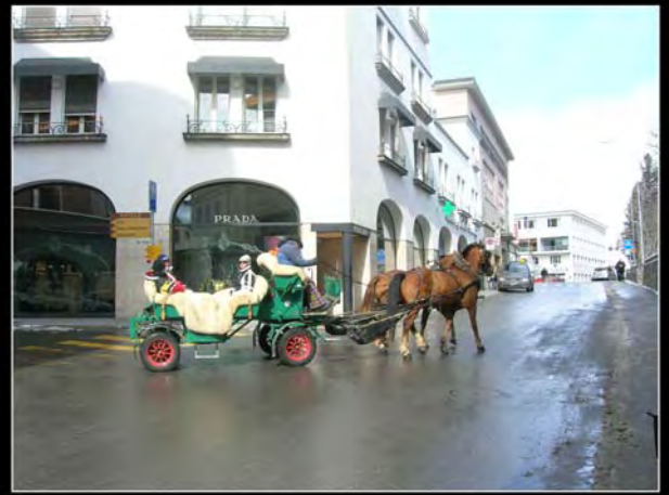
Por las calles de St. Moritz

Y el último día paseamos por Bérgamo, aunque para algunos no era la primera vez.