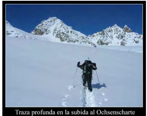
Traza profunda en la subida al Ochenscharte

1:30 Lo bueno se acaba, todos se van en dirección al Jamjoch y nos tocaría abrir huella desde unos 2500 m hasta casi el collado de Ochenscharte (2977m). Los esquís del que va en cabeza desaparecen por momentos. Aún así, disfrutamos de nuestro primer día con buen tiempo.