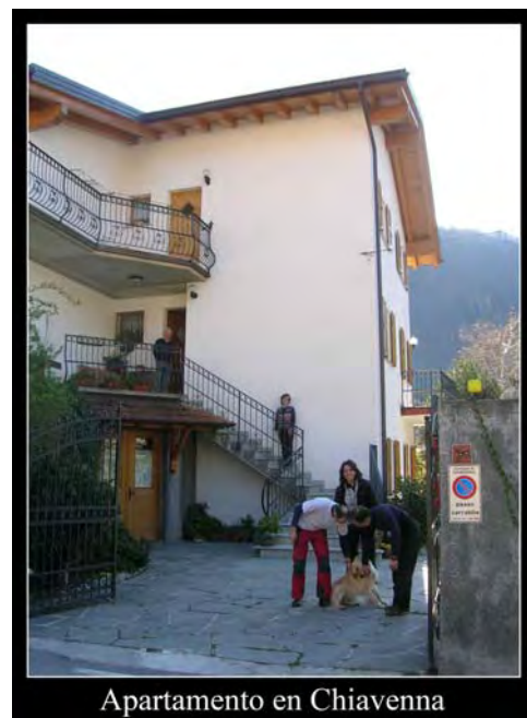
Apartamento en Chiavenna