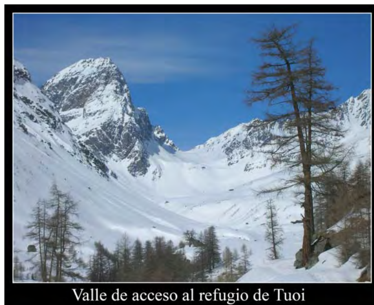
Valle de acceso al refugio de Tuoi

2:10 Llegamos a Tuoi a las 15.20, poco más de dos horas desde Guarda. El refugio no se ve prácticamente hasta que lo tienes encima. Acogedor y no muy grande, su entorno ya empieza a ser espectacular. Por la tarde comienza a nevar ligeramente.