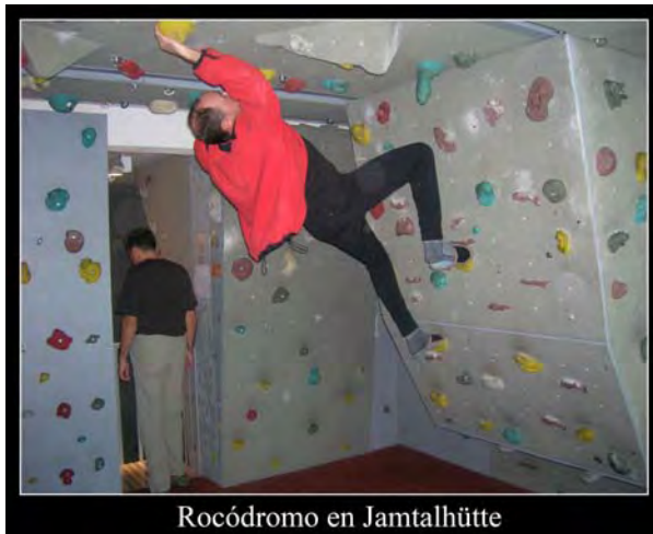
Rocódromo en Jamtalhütte

bajada, que casi no esquiamos, la huella desaparecía por momentos... El resto del tiempo lo dedicamos a echar unas risas, ver cómo nevaba, intentar un jaque mate, “escalar” en el rocódromo, comer y esperar que se cumpla el pronóstico para el día siguiente.