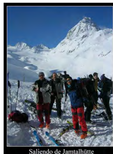
Saliendo de Jamtalhütte

0:00 Cuando salimos, a las 9:00, ya está totalmente despejado. Varios grupos han salido por delante, por lo que aprovecharíamos su huella lo máximo posible.