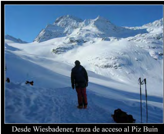
Desde Wiesbadener, traza de acceso al Piz Buin

0:00 Comenzamos a foquear a las 8:35, con tranquilidad, pues tenemos todo el día para una subida de 600 metros hasta el