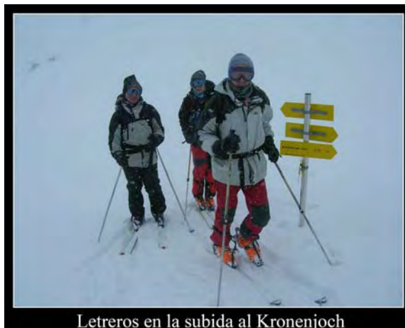
Letreros en la subida al Kronenjoch

1:15 Siguiendo la huella de un grupo numeroso, llegamos hasta unos 2500 metros. En la