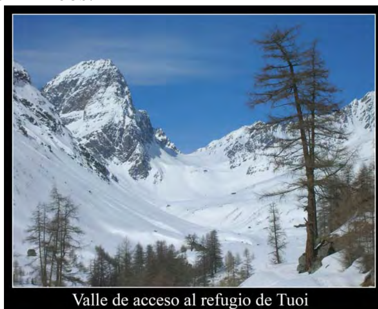
Valle de acceso al refugio de Tuoi

2:10 Llegamos a Tuoi a las 15.20, poco más de dos horas desde Guarda. El refugio no se ve prácticamente hasta que lo tienes encima. Acogedor y no muy grande, su entorno ya empieza a ser espectacular. Por la tarde comienza a nevar ligeramente.